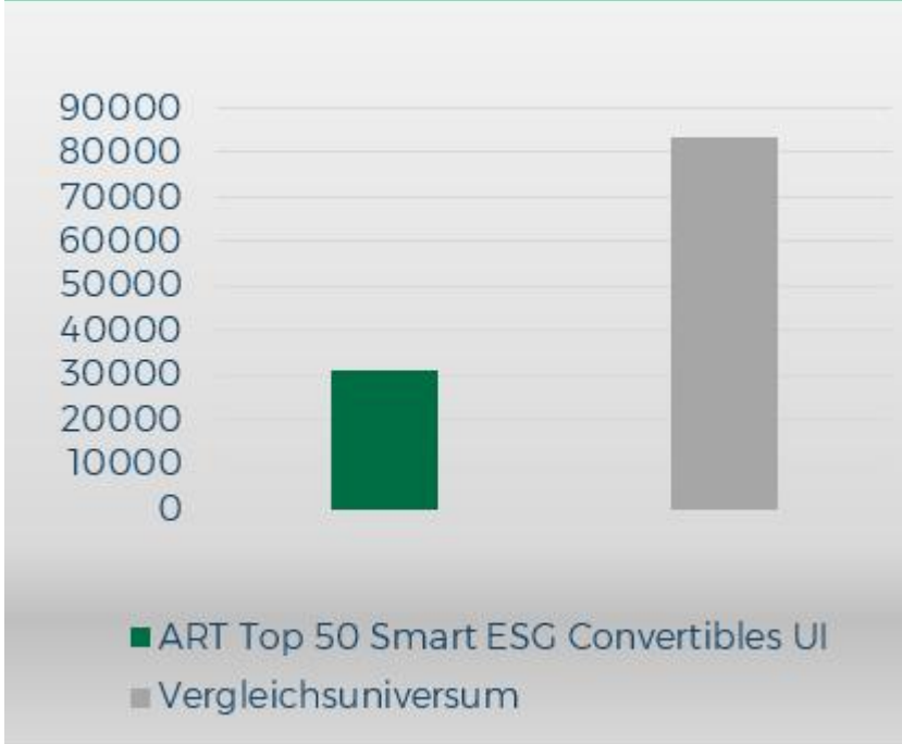
Wasserverbrauch in Kubikmeter je 1 Mio. EUR Umsatz