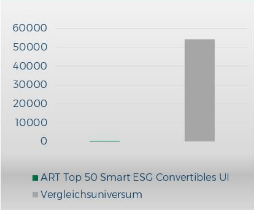
Abfall in Tonnen je 1 Mio. EUR Umsatz